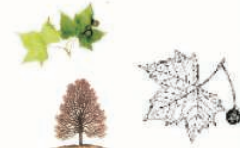
Platanus hispanica ( Platanus hispanica )