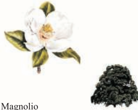
Magnolio ( Magnolia grandiflora )