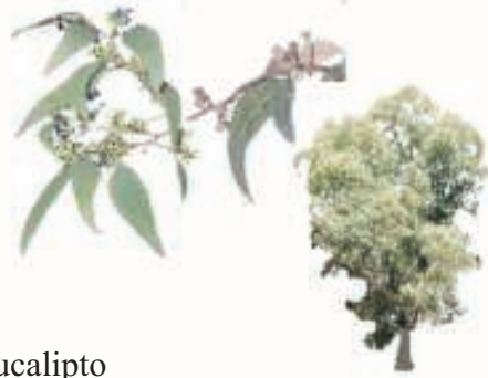
Eucalipto ( Eucalyptus globulus )