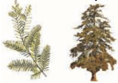
Ciprés de los pantanos ( Taxodium distichum )