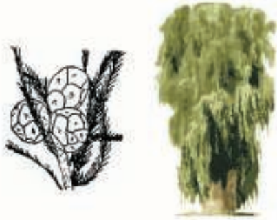
Ciprés calvo ( Taxodium mucronatum )