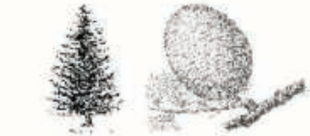
Cedro del Atlas ( Cedrus deodara )