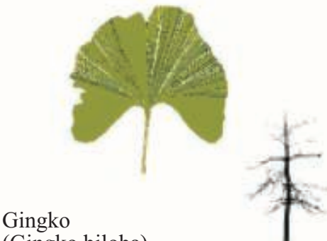
Gingko ( Ginkgo biloba )