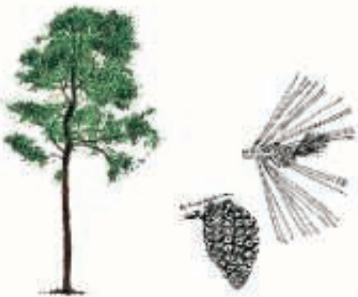
Pino carrasco ( Pinus halepensis )