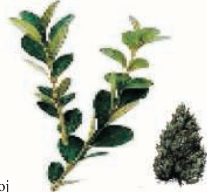
Boj ( Buxus sempervirens )