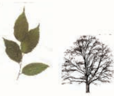
Almez ( Celtis australis )