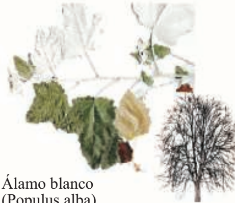
Álamo blanco ( Populus alba )